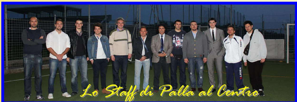
Lo Staff di Palla al Centro