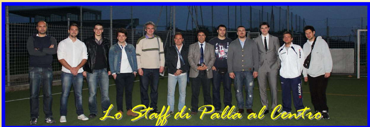
Lo Staff di Palla al Centro