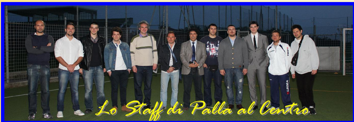
Lo Staff di Palla al Centro